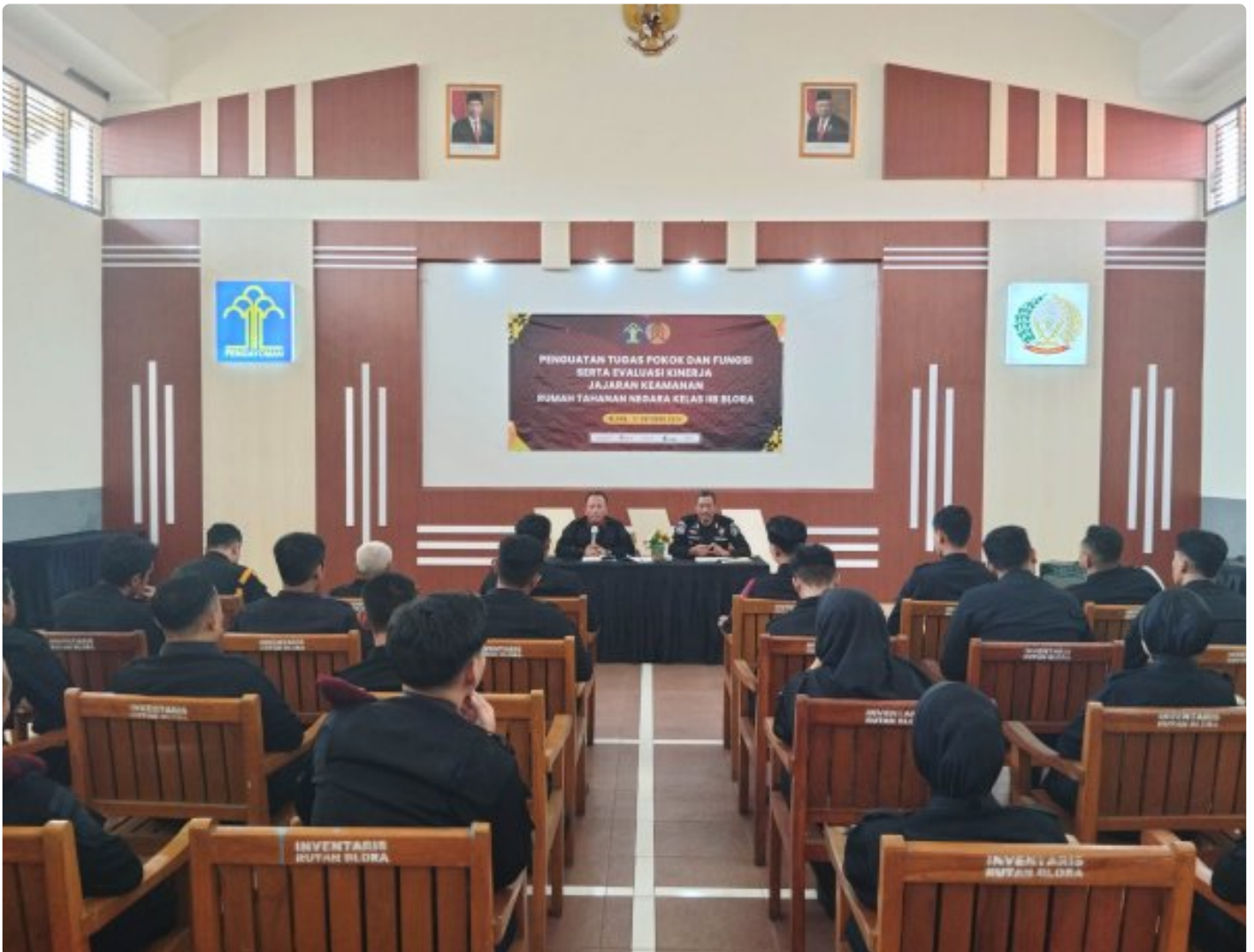
Rutan Blora Gelar Penguatan Tusi dan Evaluasi Kinerja untuk Jajaran Pengamanan